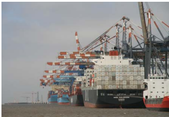
Die Gesamtlänge der Containerpier...5,3 km

Über 90 Abfahrten von der Columbuskaje sind dieses Jahr bereits fest eingeplant !!