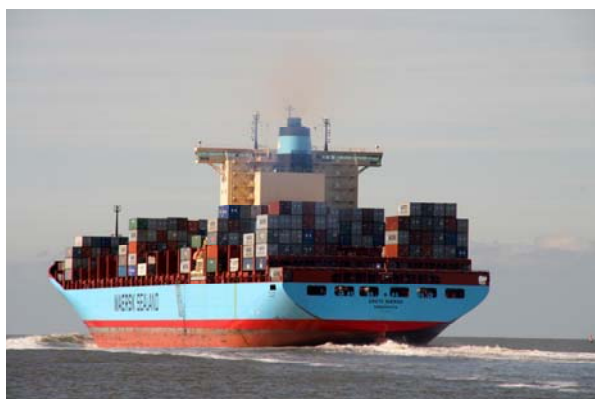
Einer der Großen läuft aus Bremerhaven aus !