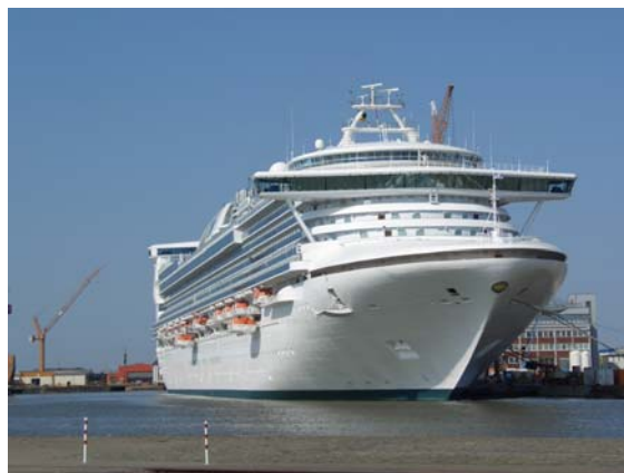
Eines der Traumschiffe, Die MS „STAR PRINCES“ kurz vor der Abreise