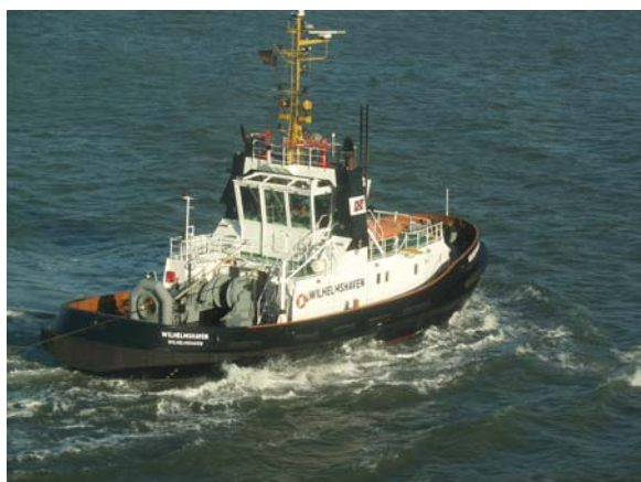
Der 6000 PS Schlepper auf dem Weg zum nächsten Job...