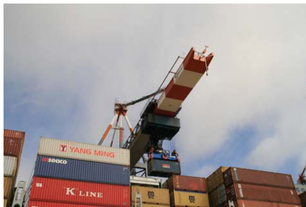
Zum Greifen nah.... die großen Schiffe und Anlagen