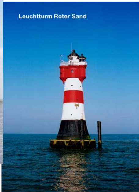
Leuchtturm Roter Sand

Der älteste Leuchtturm in der Deutschen Bucht, erbaut im Jahre 1856