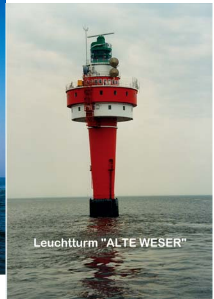
Leuchtturm "ALTE WESER"

Auf dieser beliebten Tour fühlen sich die See(h)leute richtig wohl, denn es gibt viel zu erzählen von den Türmen, der Tierwelt und den Ozeanriesen ! Lassen Sie sich verzaubern und genießen ein Hauch der großen weiten Welt !!