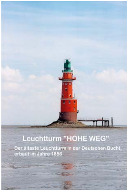
Leuchtturm "HOHE WEG"