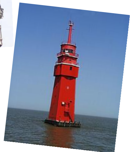
Der Leuchtturm „ROBBENPLATE“