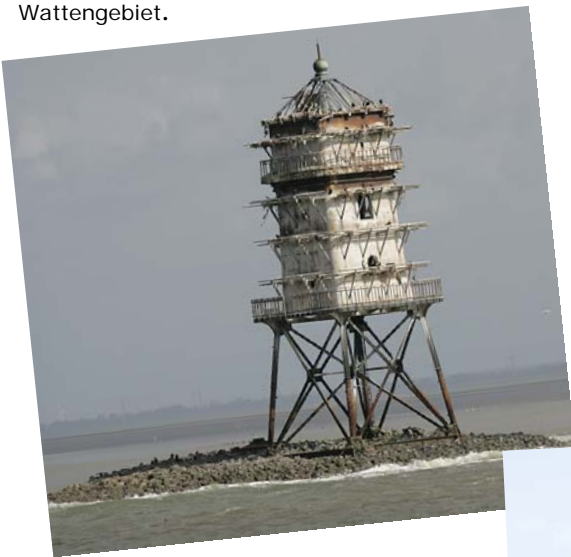
Der „Kormoranturm“ mit den Nestern