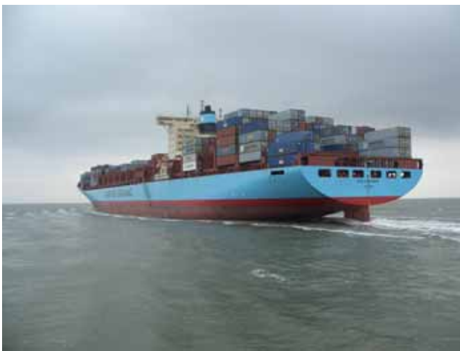
Die CS „Albert Maersk“ eines der größten Containerschiffe der Welt!!

Die Sandbank „Robbenplate“ führte zu Beginn des 20. Jahrhunderts zur Spaltung des Weserstromes in einen östlichen und einen westlichen Arm. Der neue, heute genutzte westliche Arm heißt „Fedderwarder Fahrwasser“ und bildet die Zufahrt nach Bremerhaven und den anderen Weserhäfen bis nach Bremen für die großen Schiffe. Neue Leuchtfeuer waren erforderlich. So wurde 1923 der Leuchtturm „Robbenplate“ als Oberfeuer einer neuen Richtfeuerlinie erbaut.