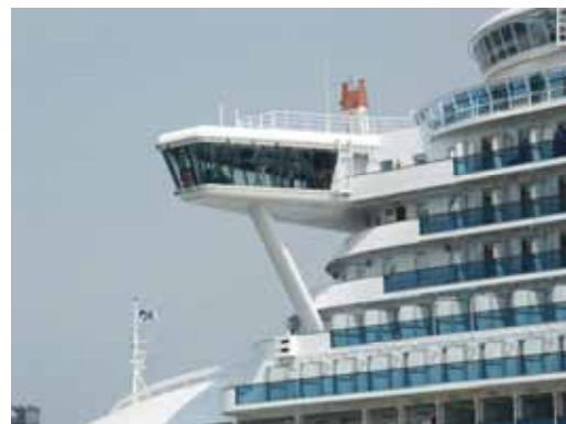
Die MS „Star Princess“ verlässt Bremerhaven