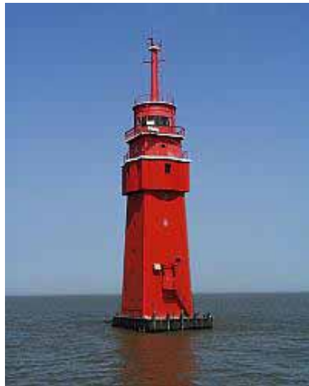
Der Leuchtturm „ROBBENPLATE“

Diese Reise führt uns von Fedderwardsiel aus in Richtung Hauptfahrwasser der Weser. Es ist eine unserer kürzesten Fahrten. Auf der Fahrt zum Leuchtturm fahren wir ein Stück gemeinsam mit den großen Ozeanriesen die Weser Richtung Süden. Die Rückfahrt führt dann über den Mittelriel durch die Watten zurück nach Fedderwardsiel