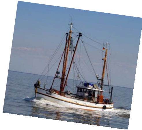
Der Kutter auf den Weg zu den Fanggründen...