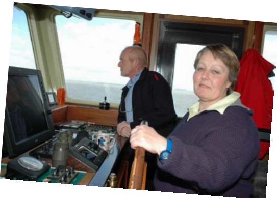
Der Steuermann hat alles im Griff...