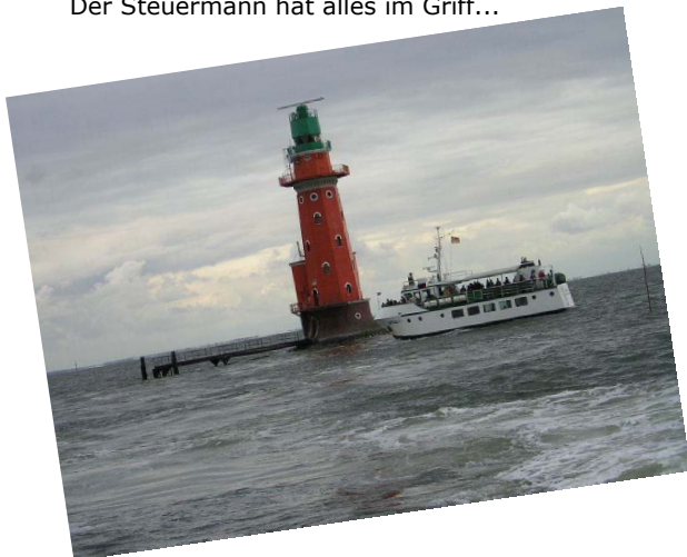
Die Wega II am Leuchtturm „Hohe Weg“

Auf dieser tollen Tour geht es zu einer der größten Sandbänke und zum ältesten Leuchtturm an der deutschen Küste.