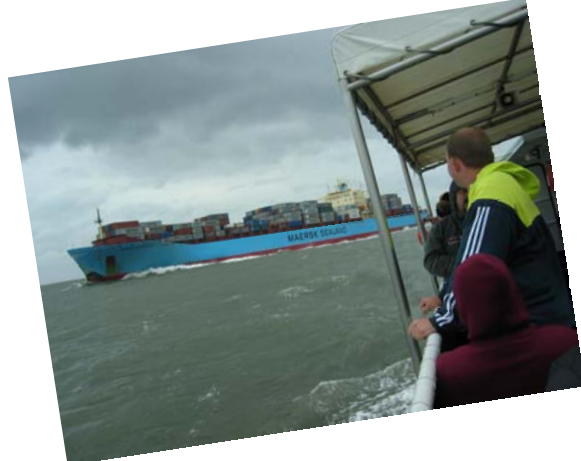
Wir sind auf dem Weg zu den Seehunden... und der Ozeanriesen steuert Richtung See